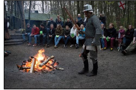
Kampvuurprogramma tijdens St. Jorisdag