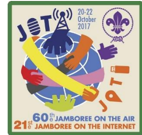
Jota – Joti logo 2017