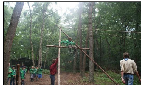
Overvliegen van een welp naar de scouts

Heeft een lid de leeftijd bereikt dat hij door mag naar de volgende speltak, dan vliegt hij over. Dit is een echte Scouting traditie! De leiding bepaalt wanneer een lid gaat overvliegen, soms wordt ervoor gekozen om nog even een tijdje te wachten, bijvoorbeeld om een grotere groep in één keer te laten overvliegen. Voordat een lid overvliegt mag hij stagelopen bij de volgende speltak zodat er alvast kennis gemaakt kan worden met de speltak en de (bege)leiding.