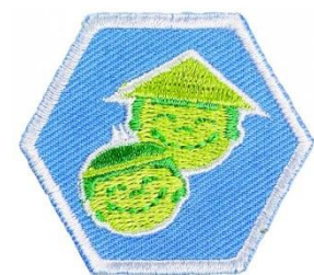
Insigne "Cultuur" (welpen)

De programma's van de wekelijkse opkomsten en kampen worden door de leiding gemaakt. Deze programma's worden in principe niet van tevoren bekend gemaakt aan de leden. Uitgezonderd zijn afwijkende programma's zoals een kamp of een activiteit welke wordt georganiseerd met andere Scoutinggroepen. Daarnaast maken de explorers en roverscouts natuurlijk hun eigen programma's. Bij de Scouting wordt er regelmatig met vaardigheidsinsignes gewerkt. Aan deze insignes wordt meestal tijdens opkomsten gewerkt maar het kan ook voorkomen dat er een thuisopdracht gedaan moet worden. Vanzelfsprekend wordt er bij de scouts en explorers meer zelfstandigheid verwacht dan bij de welpen.