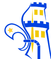
Logo Scouting IJsselgroep